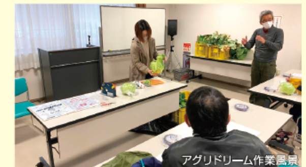
アグリドリーム作業風景

花き区画では、景観用のネモフィラ栽培にチャレンジしており、5月～6月に青色の小花が風に揺られる姿をお見せできればと思います。