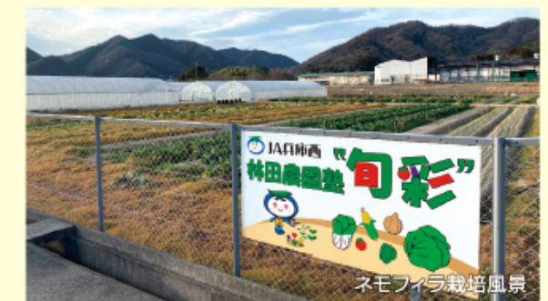
ネモフィラ栽培風景